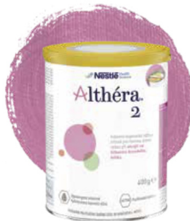
Extenzivně hydrolyzovaná kojenecká výživa s laktózou od ukončení 5. měsíce