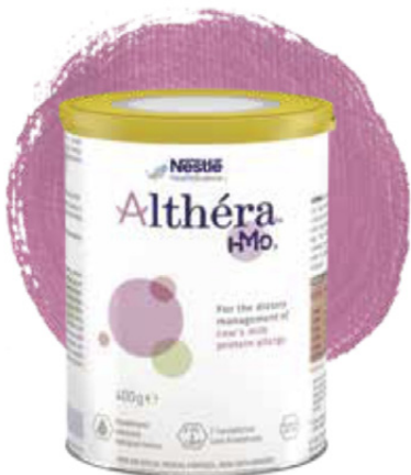
Extenzivně hydrolyzovaná kojenecká výživa s laktózou a HMO (2'FL a LNnT)