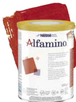
Aminokyselinová kojenecká výživa od narození

Althéra® HMO, Alfaré® a Alfamino® jsou nutričně kompletní kojenecké výživy určené jako jediný zdroj výživy do 6 měsíců věku dítěte a jako doplňková strava kombinovaná s vhodnými potravinami po 6 měsících věku. Althéra® 2 je přizpůsobena výživovým potřebám dětí od ukončení 5. měsíce. Althéra® HMO obsahuje dvě složky oligosacharidů mateřského mléka (HMO): 2'-Fukosyllaktózu (2'FL) a Lakto-N-neotetraózu (LNnT), které podporují rozvoj imunitního systému kojenců. 2'FL a LNnT nejsou přímo získávány z mateřského mléka, ale jsou strukturně identické s oligosacharidy nacházejícími se v mateřském mléce.