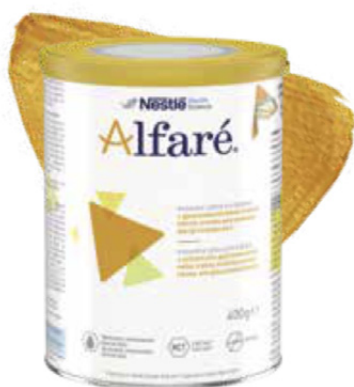
Extenzivně hydrolyzovaná kojenecká výživa bez laktózy